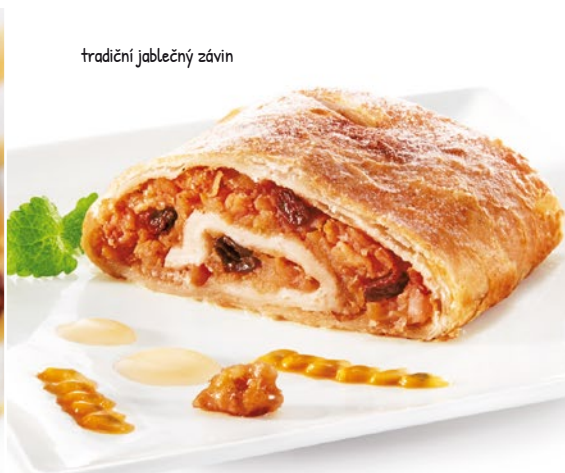
tradiční jablečný závin